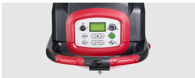
Интуитивно понятная панель управления с ЖК-дисплеем у всех моделей (на иллюстрации: AS6690T)