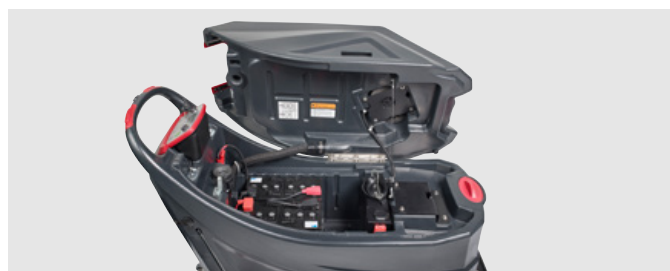
Ручка на баке для грязной воды позволяет удобно его наклонять